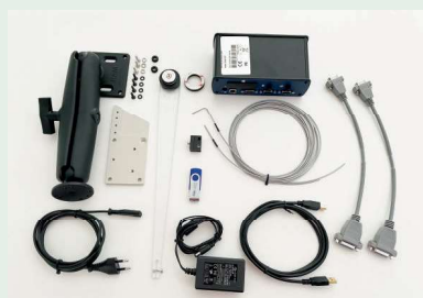
M2 Software, 63AAA407 / 63AAA462