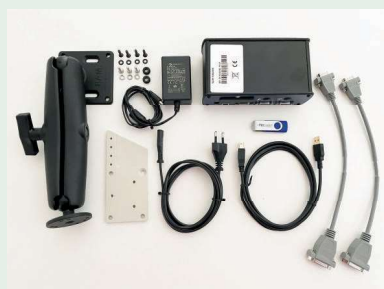
M2 Software, 63AAA406

Konstrukční typy, jako jsou průřezy a koncové body, lze vytvořit z grafického zobrazení dílu.