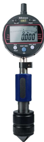
543-340B-10 s 011445