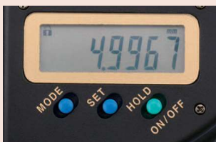
Číselný krok 0,1 µm