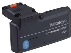
264-626 + 02AZF310 U-WAVE-TMB + Připojovací jednotka