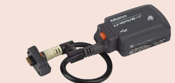
02AZD730G + 02AZD790A U-WAVE-T (přijímač) a přípojovací kabel