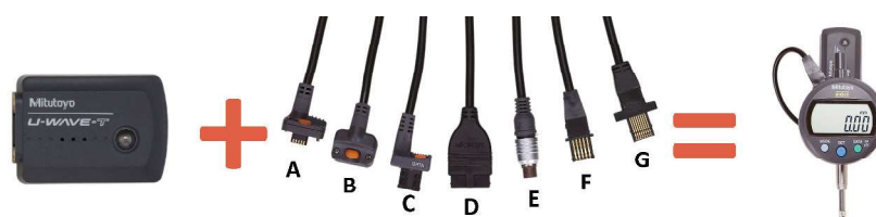
Vysílač a propojovací kabely (viz další strana) např. pro digitální úchylkoměr