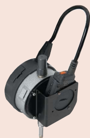
02AZF670 + U-WAVE-TM