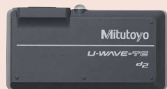
264-620 + 02AZF310 U-WAVE-TC (vysílač) + přípojovací jednotka