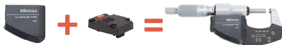
Vysílač a přípojovací jednotka (viz další strana) pro třmenový mikrometr (U-WAVE-TM + obj. č. 02AZF310)