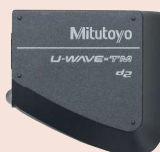
264-622 + 02AZF310 U-WAVE-TM (vysílač) + přípojovací jednotka