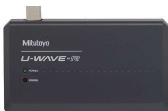
Obj. č. 02AZD810D U-WAVE-R (přijímač)