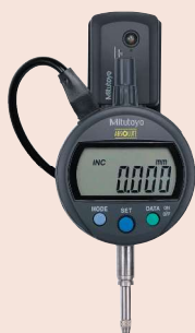
02AZE200 + U-WAVE-T