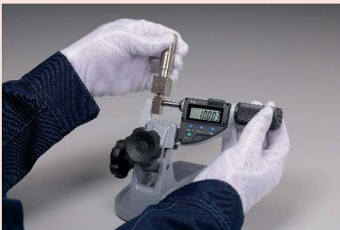
293-666-20 s upevňovacím zařízením 156-101-10 (vol. příslušenství)