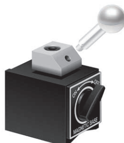
Magnetická základna 45°