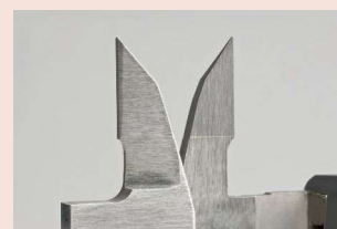
Měřicí čelisti pro vnější/vnitřní měření osazené tvrdokovem Obj. č. 505-735