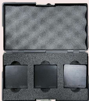
64AAA964 Shore A