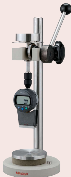
Měřicí stojánek: - Velikost stolu: ø 90 mm - Max. výška vzorku: 90 mm