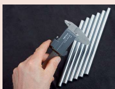
Posuvné měřítka s bezdrátovým systémem přenosu dat U-WAVE fit