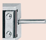
Provedení s kulatým hloubkoměrem