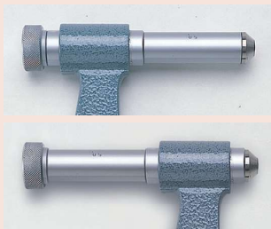
Uchytení nastavitelného doteku