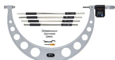
340-520 (modely s roz. měř. nad 300mm bez ochrany IP65)