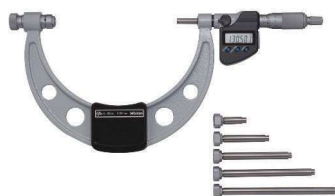
340-251-30 (IP65 pro modely s roz. měř. do 300mm)