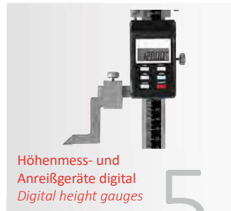
Höhenmess- und Anreißgeräte digital Digital height gauges