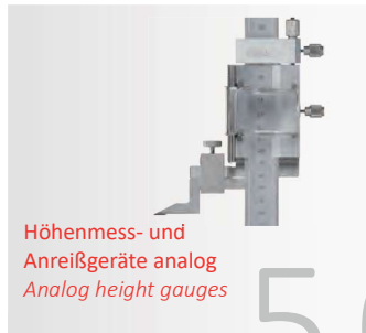
Höhenmess- und Anreißgeräte analog Analog height gauges